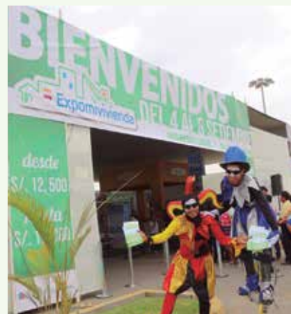
Acto inaugural concitó atención del público piurano.