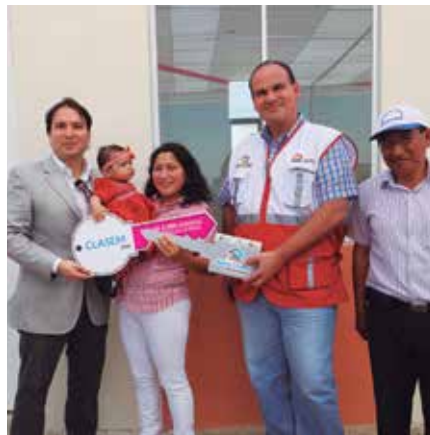
Entrega de llaves en Urb. Santa Margarita II.