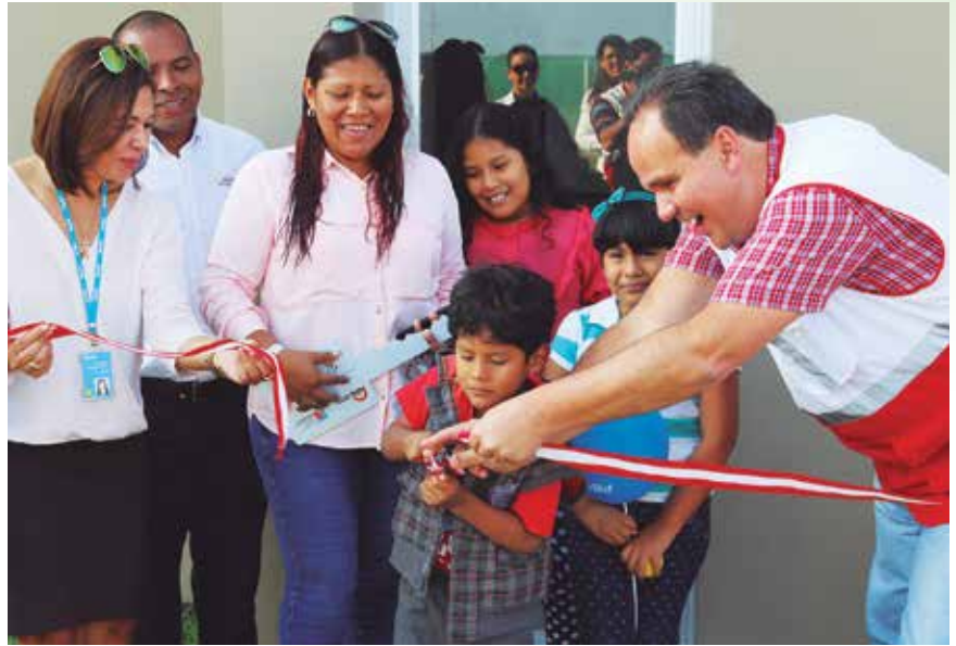
Corte de cinta en Condominio Veranda-Albamar.

Por último se realizaron visitas al proyecto Villa La Planicie de Los Portales, y la caseta de ventas del proyecto Los Corales de Inmobiliaria Alegra Marbella.