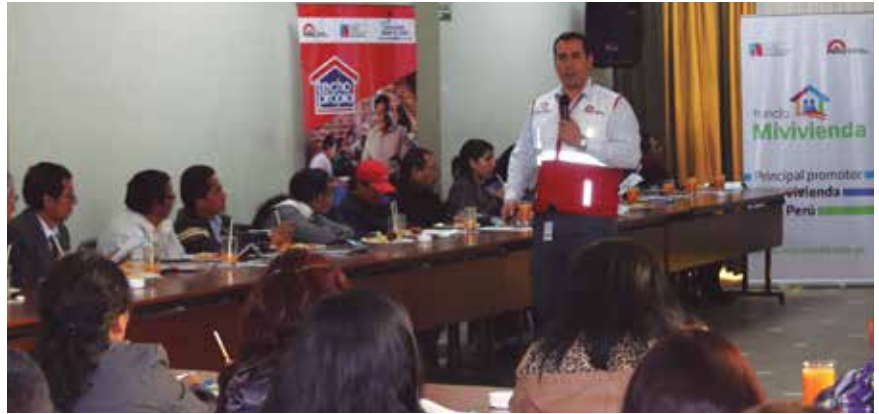
Ley de Arrendamiento acaparó la atención de los asistentes al evento.

Asimismo, se realizó una capacitación a la plana de ventas de tres agencias del Interbank en la ciudad, y luego se llevó a cabo nuestra conferencia de prensa que contó con la participación de los principales medios de comunicación, promotores y desarrolladores inmobiliarios y entidades financieras. Los temas que concitaron la atención del público fue el arrendamiento inmobiliario (en sus diversas modalidades), y el Bono de Vivienda Sostenible.