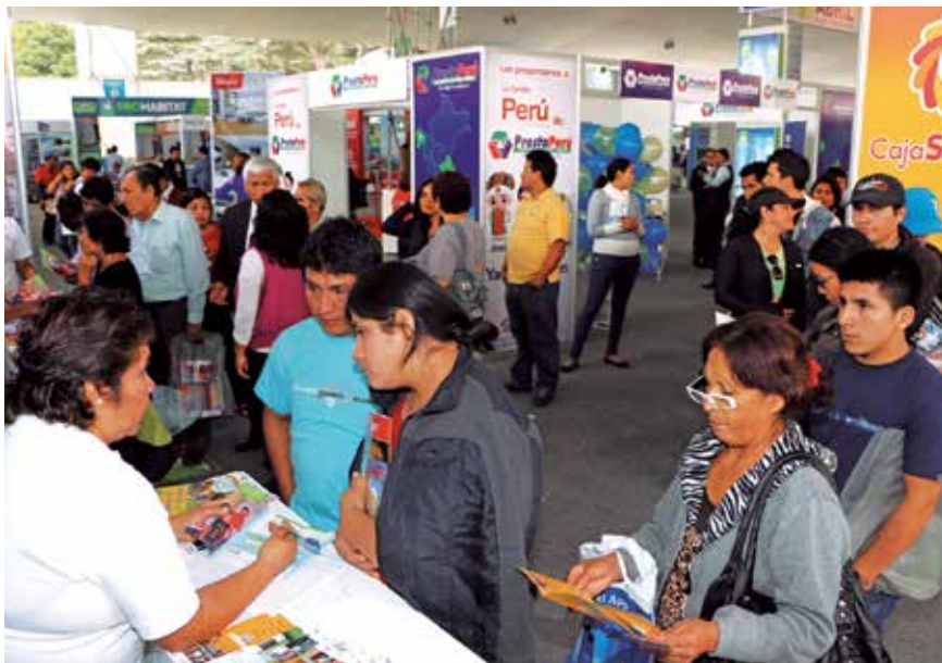
Estabilidad del mercado impulsa búsqueda de viviendas.

“El mercado inmobiliario sigue expandiéndose sólo que está creciendo a un ritmo más desacelerado. Los clientes potenciales están investigando más antes de concretar una venta y el tiempo de esta operación se está extendiendo”.