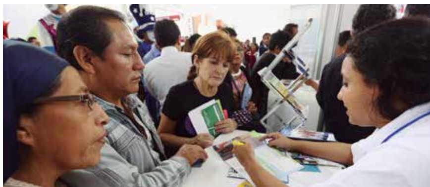
Familias tendrán más opciones para acceder a la vivienda soñada.

Explicó que si la persona no califica para un crédito hipotecario, entonces una buena alternativa sería el leasing o alquiler-venta. “Si es que no calificas a una hipoteca, pues el plazo que te piden de evaluación es muy largo y sabes que puedes ahorrar, entonces sí es importante ir por el leasing directo o alquiler con opción a compra con la hipoteca”, agregó.