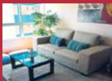
Juego de Sala