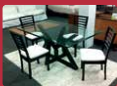
Juego de Comedor