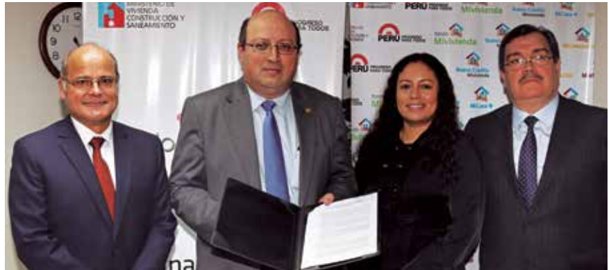
Más de 11 mil familias serán beneficiadas con una vivienda.

Construcción de megaproyecto cambiará entorno urbano de Lima Norte