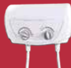
1 Therma eléctrica