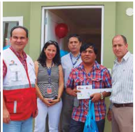
Beneficiario de Residencial Monte Verde.